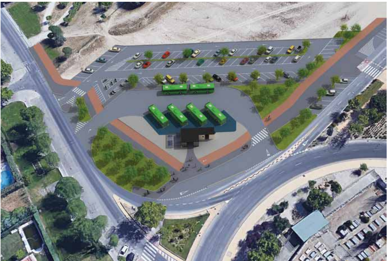
▲ Planos informativos