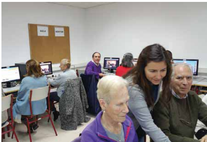
▲ Imagen de una clase de Informática en la Escuela de Adultos de Villanueva de la Cañada.

El centro ofrece enseñanzas iniciales (equivalente a E. Primaria), enseñanza Secundaria de Adultos (presencial o a distancia), Español para extranjeros, preparación para la prueba de acceso a Ciclos Formativos de Grado Superior y a la Universidad para mayores de 25 años así como formación online a través del Aula Mentor.