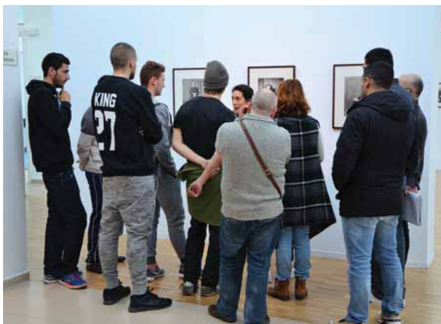
▲ Grupo de alumnos de la Escuela de Adultos visitando una exposición en el Centro Cultural La Despernada.

Las personas interesadas pueden informarse y matricularse, a partir del 1 de septiembre, en las dependencias de la Escuela de Personas Adultas (C/Real, n.º 7). El horario de atención al público es de lunes a viernes, de 10:00 a 14:00 h. Las clases comienzan el 18 de septiembre