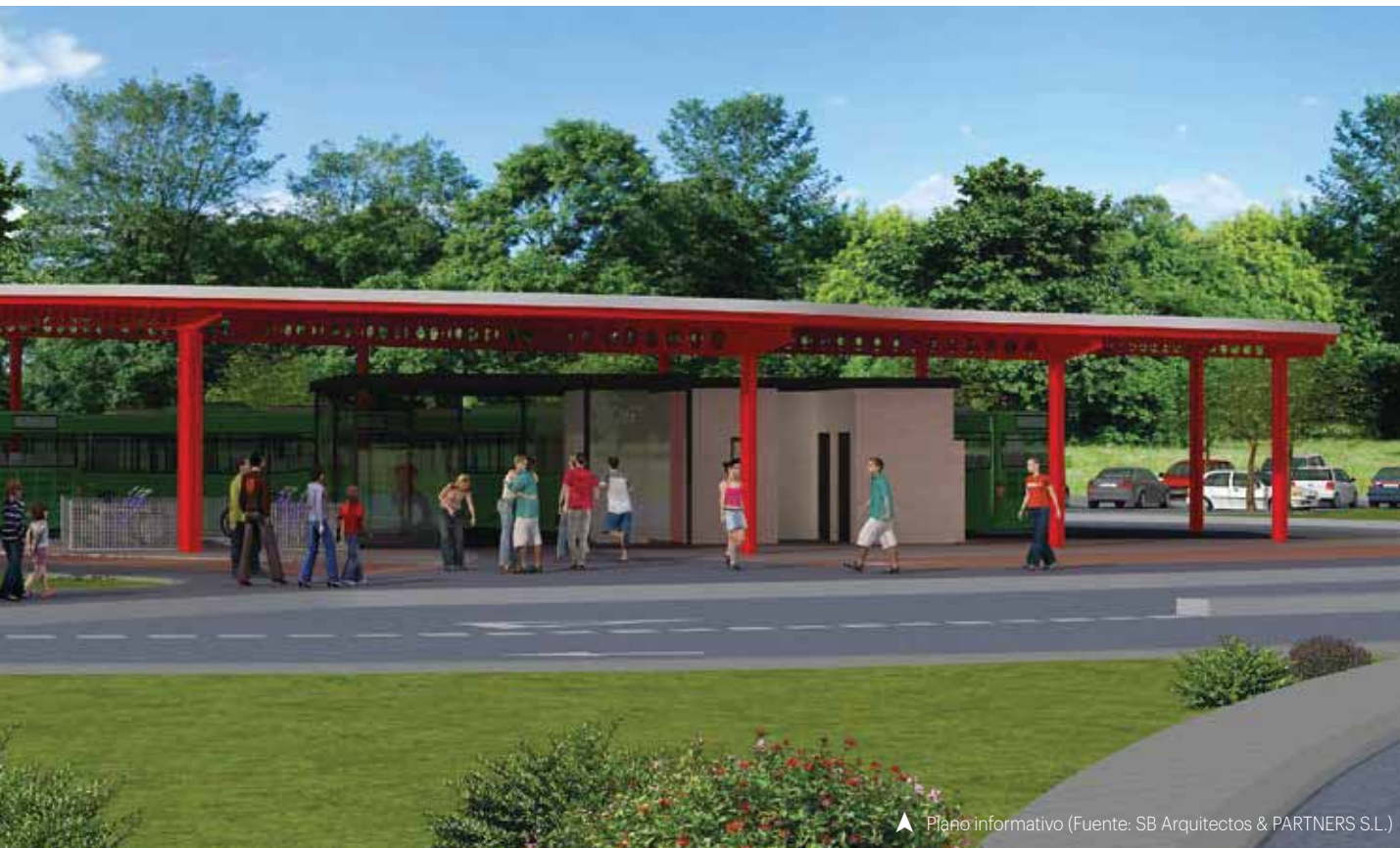
▲ Plano informativo