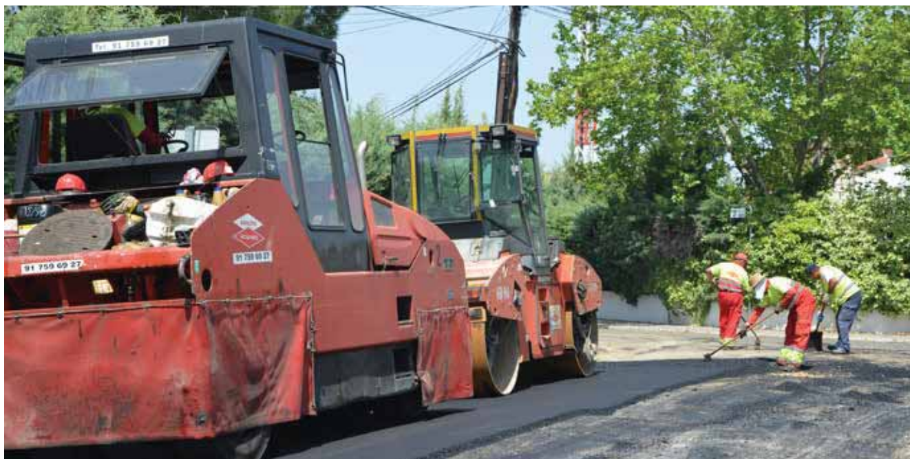
▲ Asfaltado de calles en La Raya del Palancar (Imagen de archivo).

E l Ayuntamiento va a llevar a cabo en 2017 distintas obras y proyectos por un importe cercano a los dos millones de euros, procedentes del superávit del año 2016. Dicha cuantía irá destinada a: