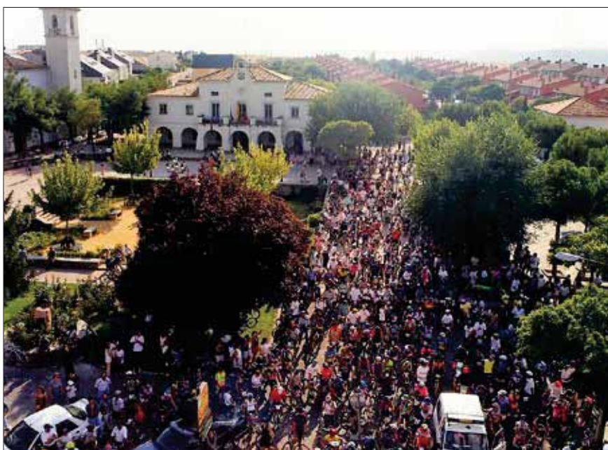
▲ Imagen de la plaza de España, salida y meta de las primeras ediciones de la Fiesta de la Bicicleta.

Además de diferentes clubes deportivos locales, en la Fiesta de la Bicicleta colaboran empresas del municipio que aportan los regalos que se sortean entre los corredores.