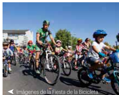
◀ Imágenes de la Fiesta de la Bicicleta.