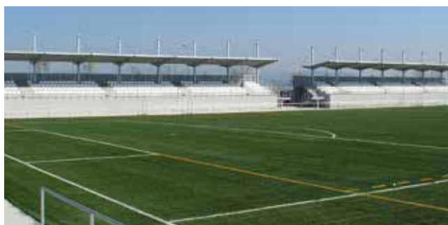
▲ Campo de Fútbol Municipal.

Por otro lado, se está tramitando el expediente de adjudicación del proyecto de rehabilitación y mejora del Campo de Fútbol Municipal. Las obras van a consistir en la sustitución del césped artificial por otro de mejores características y mayores prestaciones. También se va a proceder a la reparación del sistema de riego. La actuación se completará con la instalación de un nuevo equipamiento deportivo reglamentario (porterías, banderines, redes, etc.). Las obras, de aproximadamente 180.000 euros, serán financiadas con cargo al Plan de Inversión Regional de la Comunidad de Madrid.